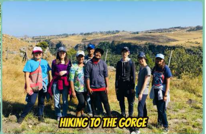
HIKING TO THE GORGE