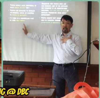
LECTURING @ DBC