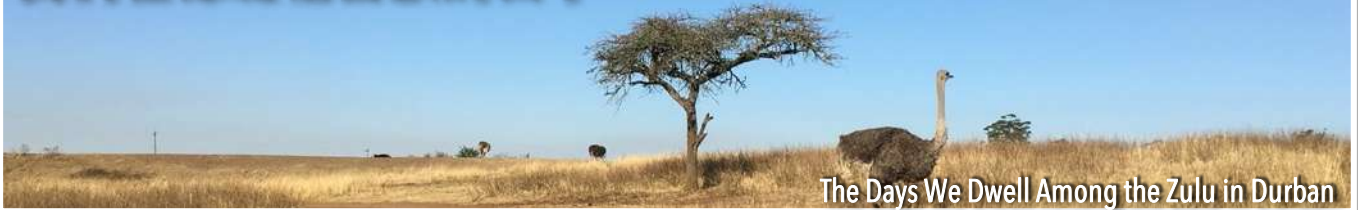
The Days We Dwell Among the Zulu in Durban