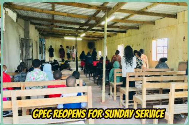
GPEC REOPENS FOR SUNDAY SERVICE