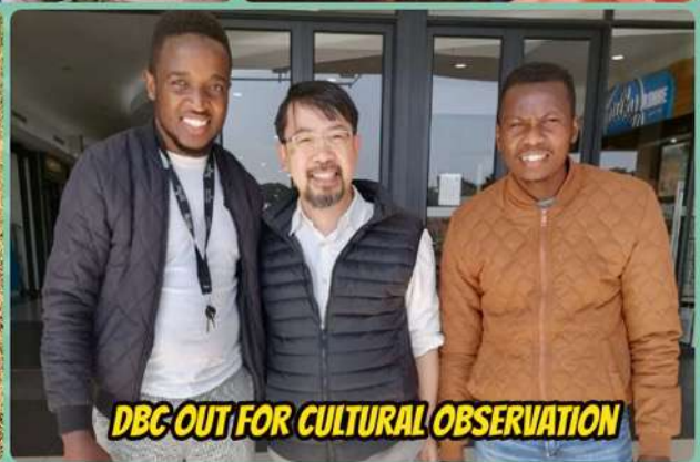
DBC OUT FOR CULTURAL OBSERVATION