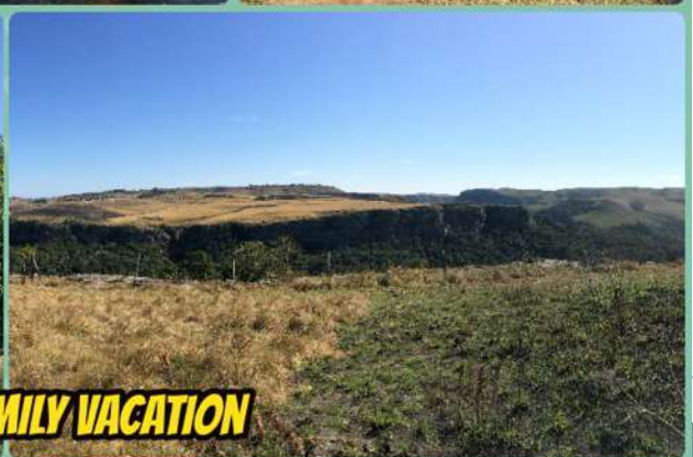
6-9 AUG, FAMILY VACATION