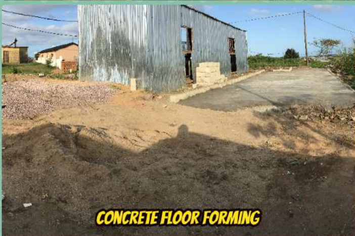
CONCRETE FLOOR FORMING