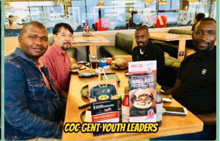
COG GENT YOUTH LEADERS