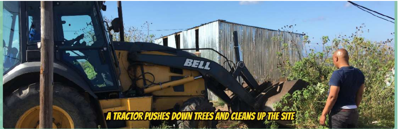
A TRACTOR PUSHES DOWN TREES AND CLEANS UP THE SITE