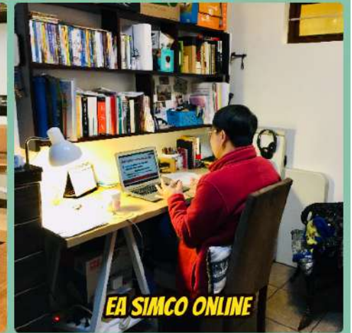
EA SIMCO ONLINE