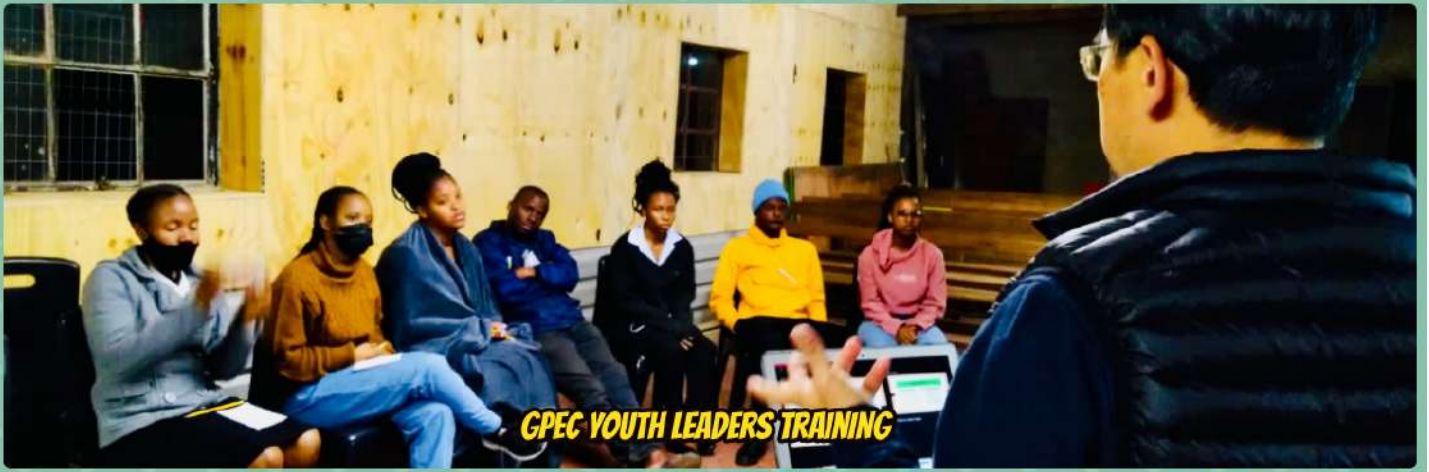
GPEC YOUTH LEADERS TRAINING