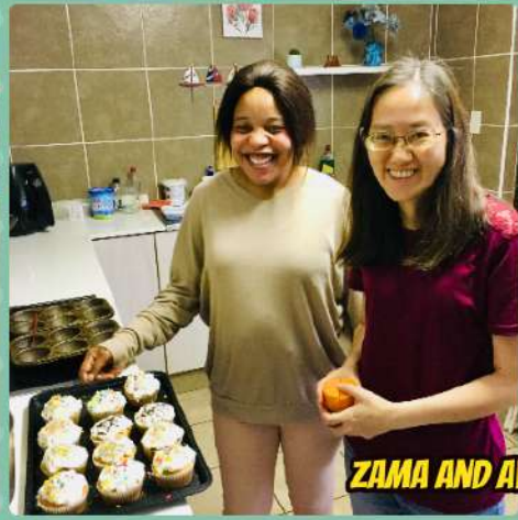
ZAMA AND AVELA VISIT US