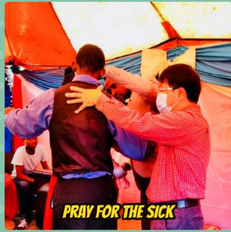
PRAY FOR THE SICK