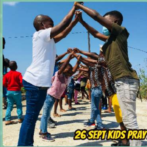
26 SEPT KIDS PRAY AND PLAY ON THE SITE