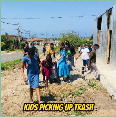
KIDS PICKING UP TRASH