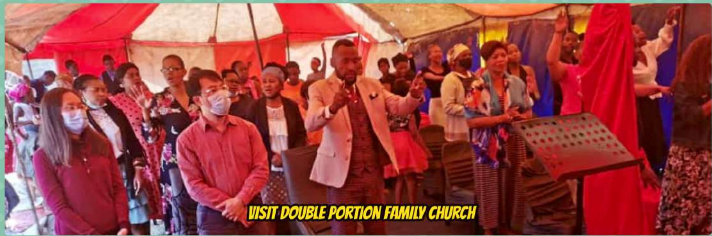
VISIT DOUBLE PORTION FAMILY CHURCH